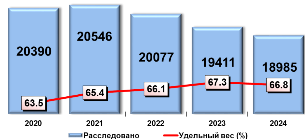
Преступления, совершенные лицами ранее их совершавшими 12 мес. 2020 - 2024 гг.

При снижении количества преступлений, совершенных в состоянии алкогольного опьянения (-13,5%; 7 017), остается высоким их удельный вес (24,7%) из числа всех преступлений. Возросло количество преступлений, совершенных в состоянии наркотического и токсического возбуждения (+93,7%; 308).