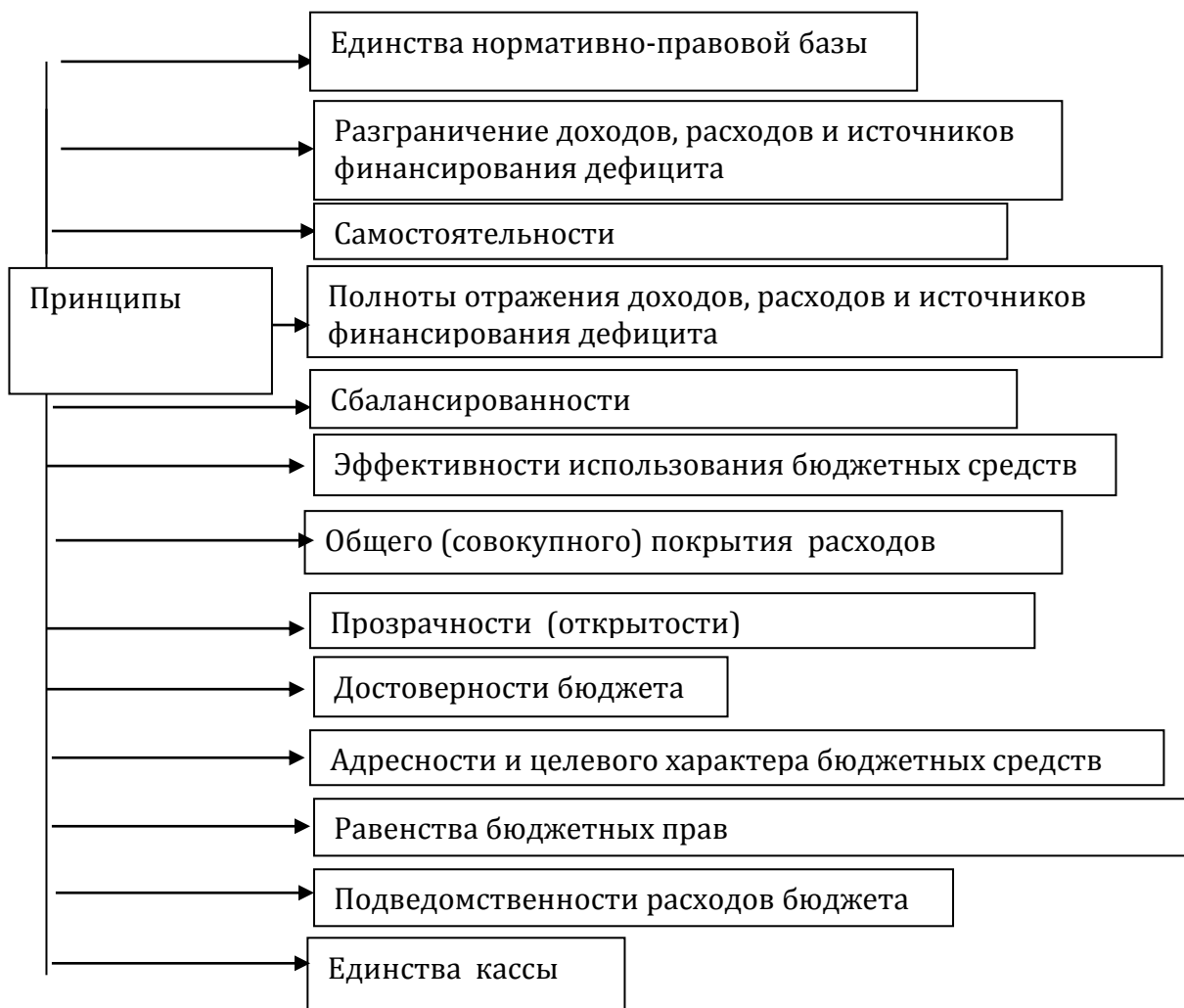
Схема 1. Принципы формирования и исполнения местного бюджета.

Следует отметить единство принципов бюджетной системы РФ и структуры бюджетной классификации для всех уровней бюджетов, что в полной мере применимо к местным бюджетам и в отношении принципов их организации может выглядеть следующим образом [18, 29, 30].