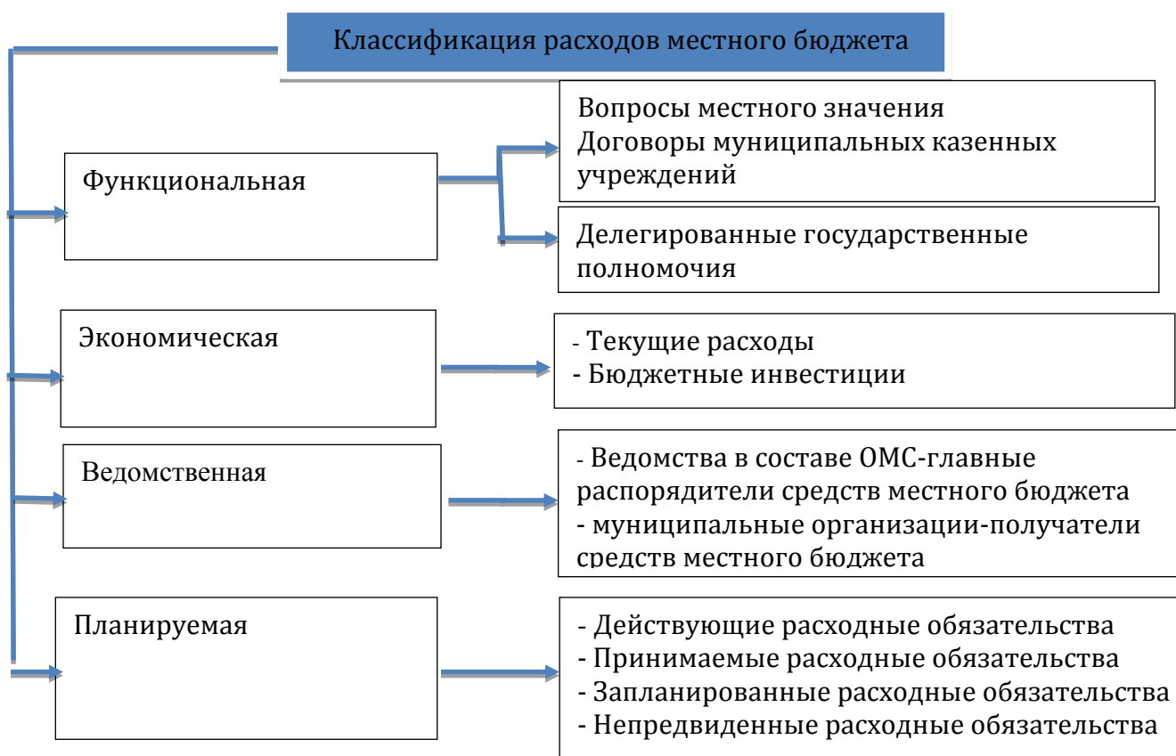
Схема 3. Критерии классификации расходов местного бюджета

Существенную долю расходов местного бюджета составляет организация предоставления муниципальных услуг сферы образования (общего, дошкольного и дополнительного для детей), культуры, физической культуры и спорта, жилищно-коммунальных, транспортного обслуживания и т.п.